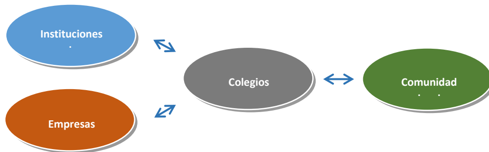
Imagen 2: La escuela como incubadora de innovación y creatividad para las comunidades de referencia.

La escuela tiene la oportunidad de crear un laboratorio de innovación para fomentar/desarrollar la innovación para la comunidad de referencia (p. ej., las comunidades locales) con el respaldo de compañías e instituciones de investigación.